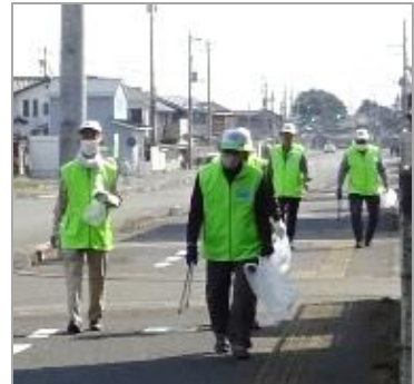
▲壬生町の環境保全とプラごみゼロの会