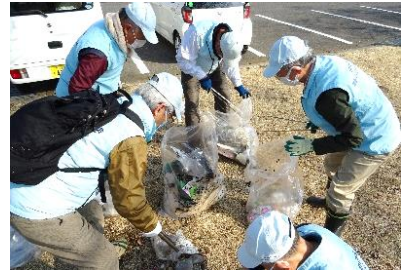
▲川の日を国民の祝日にしよう会