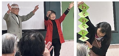
マジシャン養成塾