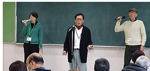
ハート＆リレーション