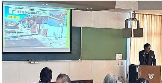
文庫＆カフェむつみ