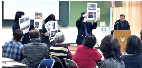
安塚駅前イルミネーション実行委員会