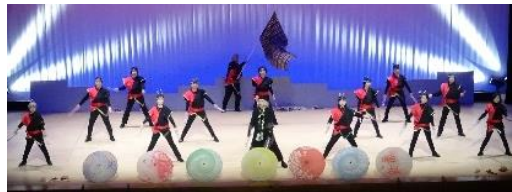
健康ダンスサークル壬生飛翔