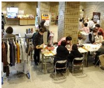
壬生町消費者友の会