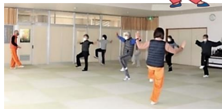
▲前回の体験レッスンの様子