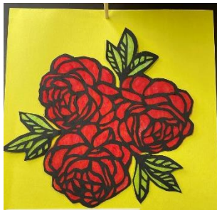
ペーパークラフト