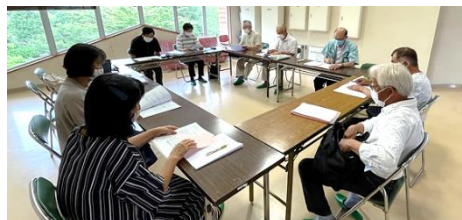
設立準備委員会のようす

なお、この活動に賛同される個人・団体・企業の方々を募集しておりますので、内容についてお知りになりたい方は、「みぶりん」までお問い合わせください。