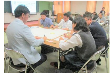
おしゃべりサロンでの ワークショップ