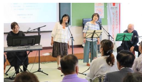
音楽グループ「にっこり」