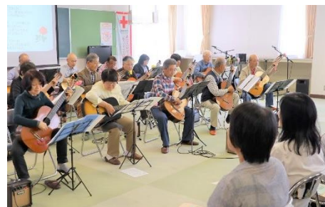
ギターアンサンブル・コパン