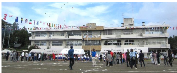
秋空に風船（合同運動会20周年記念）

いつからか、羽生田では古墳時代から連綿と続く営みに想いを馳せ、自らの地を「はにしの里」と呼ぶようになりました。その「はにしの里」の人たちが、年に一度心躍らせる時があります。それは「はにしの里大運動会」に地域が集う時です。今年は1日順延し10月20日、羽生田小学校と地域5自治会の共催となってから20回目となる記念の合同運動会が、「はばたけ羽っ子仲間を信じ 最後まで」をスローガンに実施されました。