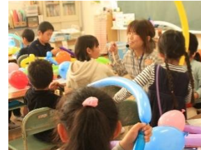
バルーンアート体験