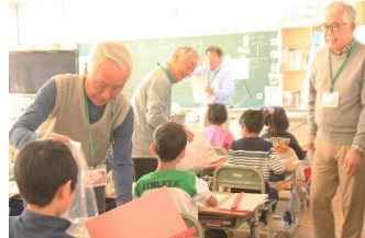
おもちゃづくり体験