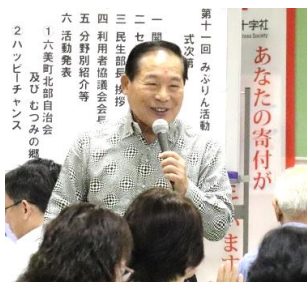
加藤カラオケ愛好会