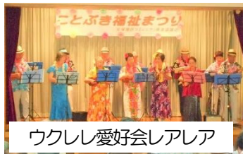
ウクレレ愛好会レアレア