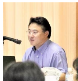
ハッピーチャンス