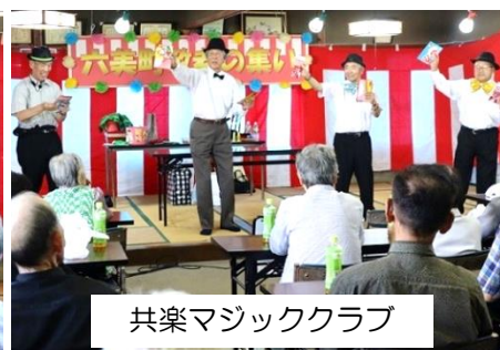
共楽マジッククラブ