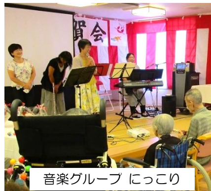
音楽グループ にっこり

音楽グループ「にっこり」の演奏と、それに合わせた全員の歌で、会場は大いに盛り上がり、みんなが元気になりました。