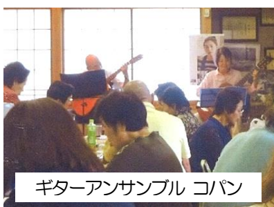
ギターアンサンブル コパン