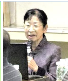
六美地区北部自治会及びむつみの郷