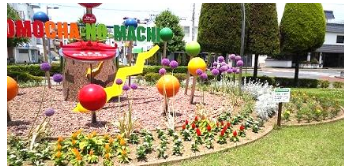
チームOW(おもちゃのまち駅西口)