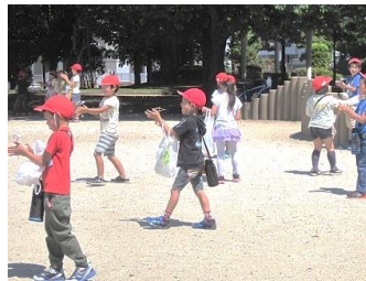
みんな大喜び、エコトンボ