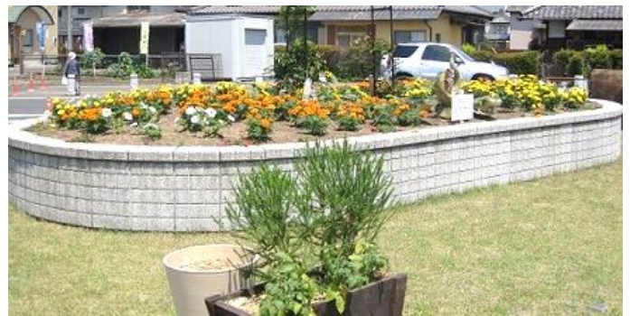
安塚駅前広場「花愛好会」