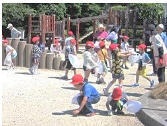
みんなで石拾い・ゴミ拾い