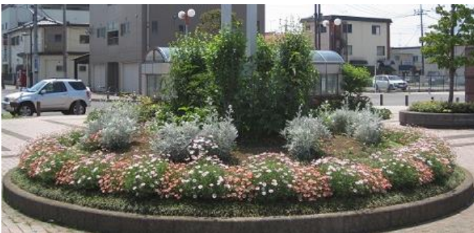
花のまちづくり「にじの会」(おもちゃのまち駅東口)