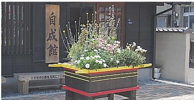
壬生町 花の街づくりの会(自成一館前、他)

5 月から 6 月にかけて、マリーゴールド、ペチュニア、ケイトウ、ニチニチソウ、ヒマワリなど、夏から秋の花を植え付けたところです。是非、満開の時期に見に行ってください！(取材担当：鈴木)