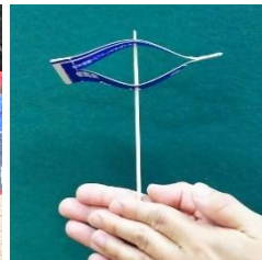
紙パックで作ったエコトンボ