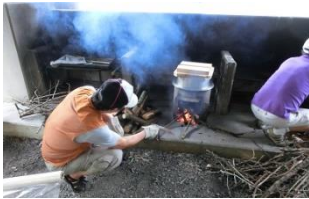
かまどで集めた枯れ木で炊飯