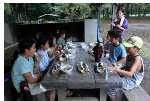
参加者の子供たちが 揃って、竹の器で食事

近年ひんぱんに災害が発生し、毎日避難情報が報道されている状況です。このような状況に如何に対応するのか日頃から避難経験をする必要性を感じ、昨年南犬飼地区公民館で開催されました「公民館に泊まろう」の運営委員が本年度は壬生町嘉陽ヶ丘にて8月27日28日の2日間にアウトドアを通じて避難所の自主運営を学ぶ事業が町民を対象に開催されました。