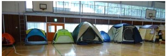
雨のため、体育館内のテント生活