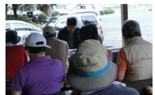
避難講演会の様子