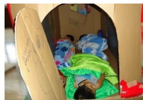
子供たち専用の 手作りハウス