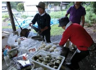
てぼう 手草におにぎりを結ぶ