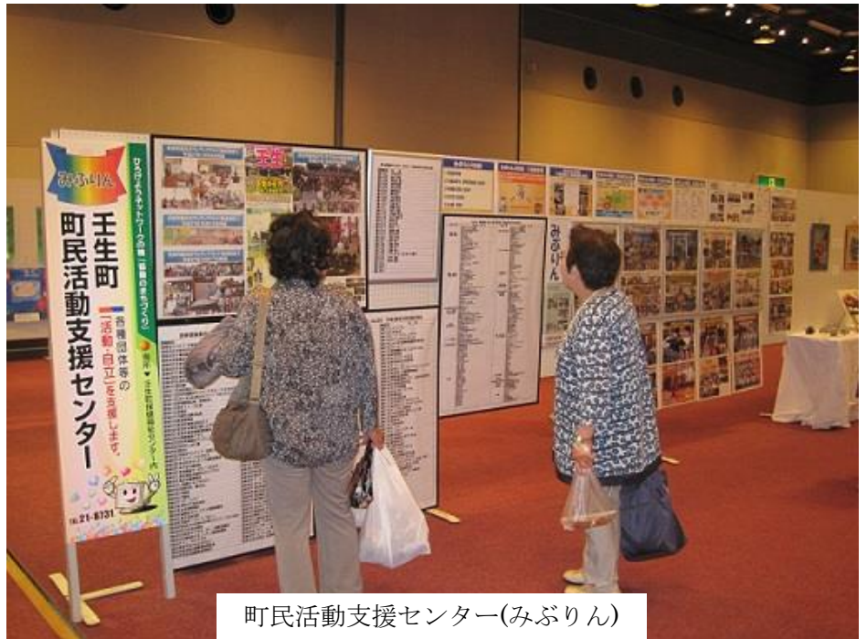
町民活動支援センター(みぶりん)

屋外では、模擬店の出店、防災・子どもイベントコーナーなどもあり、朝から大勢の人で賑わいました。