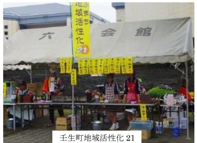
壬生町地域活性化 21