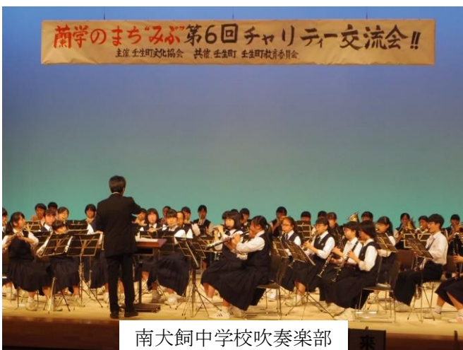
南犬飼中学校吹奏楽部