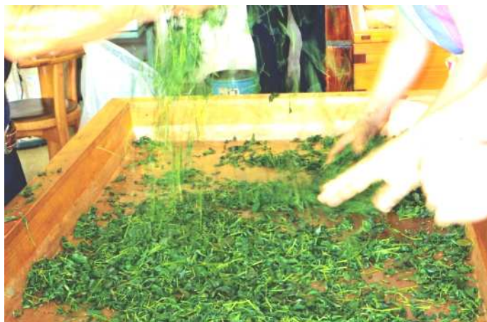
葉振るい（葉形づけ）

普段は冷凍した茶葉を使い、乾燥まで6時間かけて仕上げます。また、新茶の季節には、「茶摘み体験」や「手揉み講習会」も行っています。