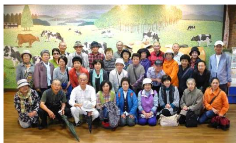
お昼を終わって満足満足、元気で記念撮影