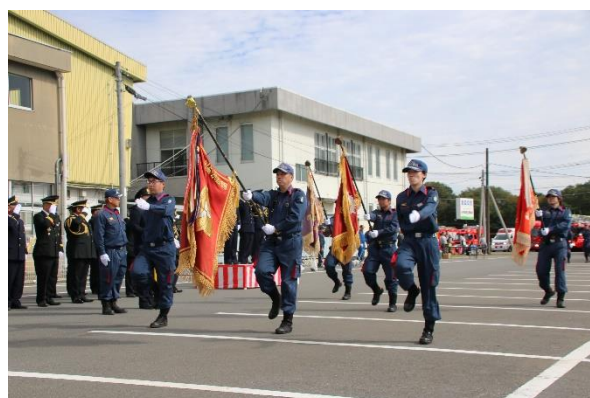
消防団分列行進 (団旗行進)