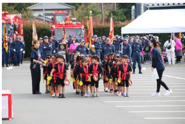
分列行進に花を添える園児たち (メリーランド保育園)