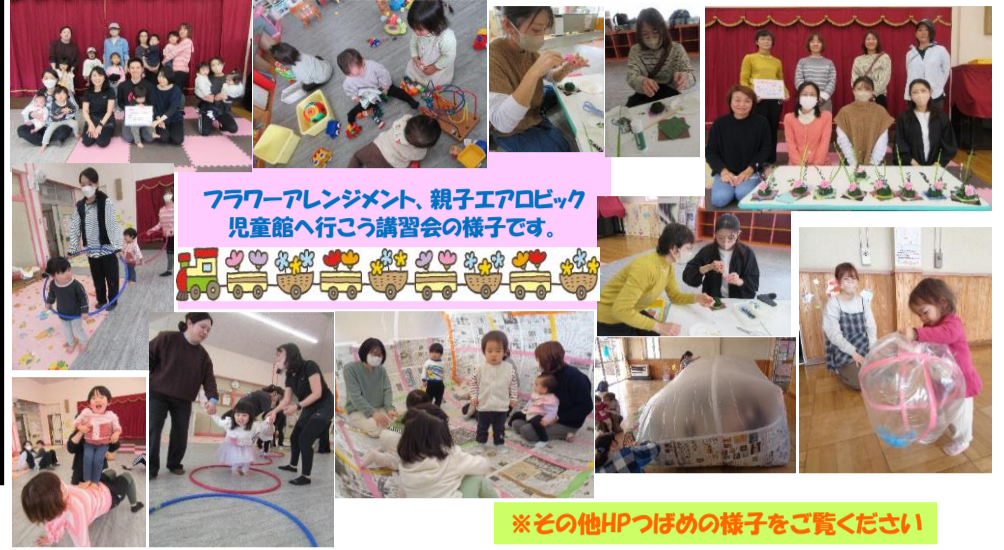
フラワーアレンジメント、親子エアロビック 児童館へ行く講習会の様子です。