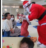
オカリタ演奏会 クリスマス観劇会