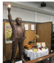
電球や蓄音機を発明 したエジソン