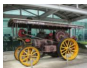
イギリス製 蒸気自動車