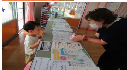
乳幼児の生活とあそび