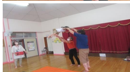
じゃれつきあそび