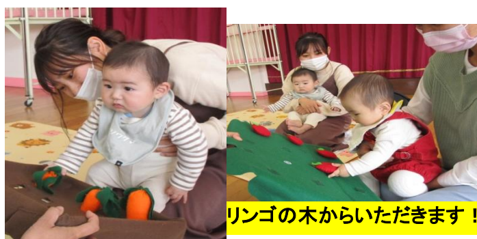
リンゴの木からいただきます！