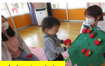
ロディーも楽しかったね