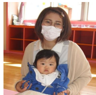
りんごをとったぞ！