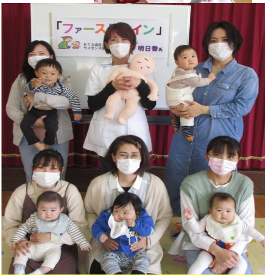
明日香先生ありがとうございました！5組のママ、お疲れ様！